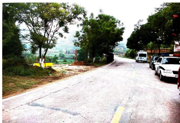
照片2 现场方位照片