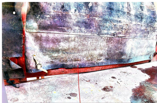
照片8 马槽右后方布底部可见刮擦印痕