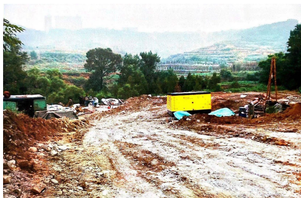
照片3 现场概貌照片