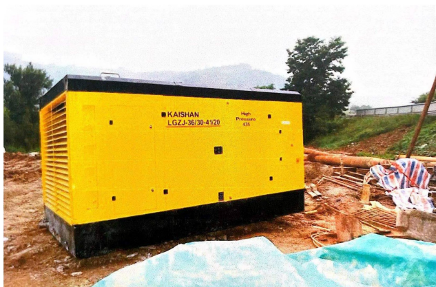
照片4 空压机现场照片