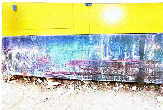
照片5 空压机右侧底部擦蹭痕迹照片