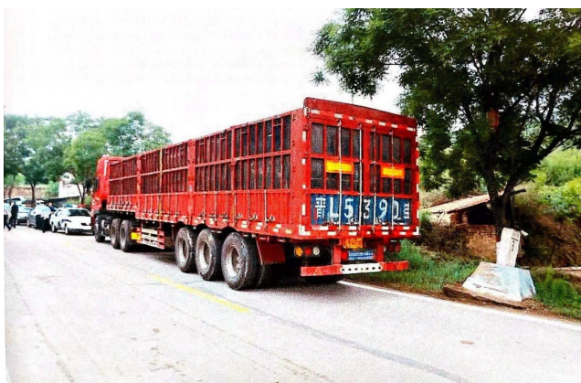
照片6 现场半挂车照片